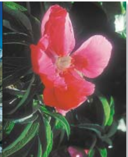
Fiore di Peonia