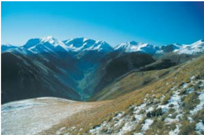
La Valle di Foce dal Monte Sibilla