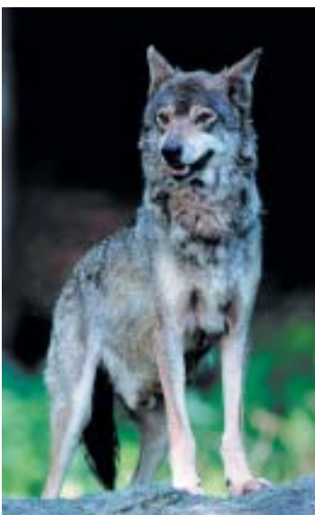
Lupo appenninico