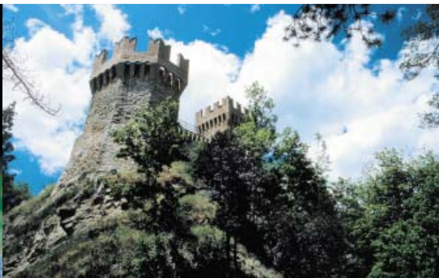
La Rocca di Arquata del Tronto