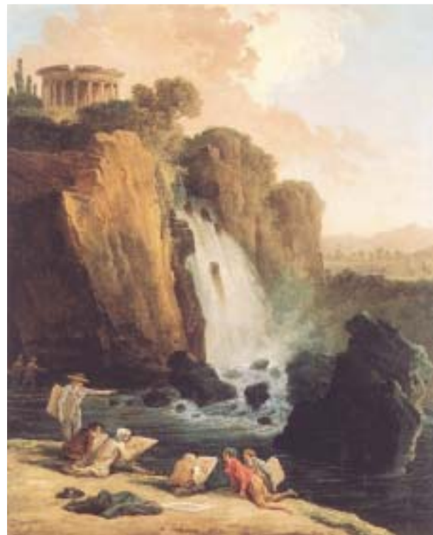
Hubert Robert Artisti davanti alle cascate di Tivoli (1794) Olio su tela 56x46,3 cm - New York - Collezione privata

In principio, in età romana, vi era la città di Tibur , già nota ai cultori del bello per l'ardita acropoli che offriva al viaggia-