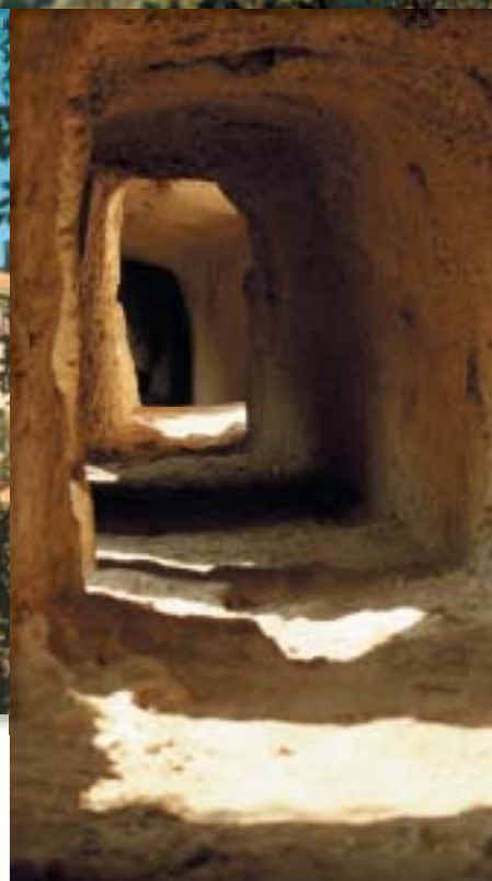
Villa Gregoriana