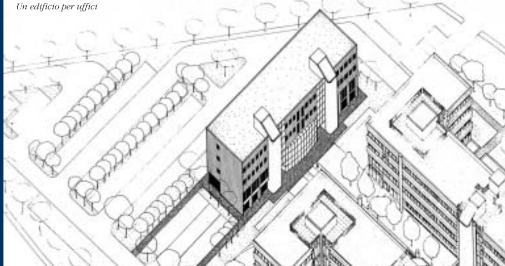
Un edificio per uffici

una più attenta coscienza della professione in grado di agire da "attore della competizione globale" nella promozione di uno sviluppo urbano e territoriale attento alle esigenze della sostenibilità e della promozione responsabile di una coesione sociale della città. Ciò riconduce altresì alla necessità di concepire il disegno della città e del territorio come un processo non graduale di continua riflessione sulle proprie identità e potenzialità: la progettazione, sia architettonica che urbanistica, non è il risultato di un "estro" momentaneo, ma un paziente lavoro di ricomposizione, ottimizzazione, modernizzazione, che nasce appunto dalla coscienza e dalla riflessione storica.