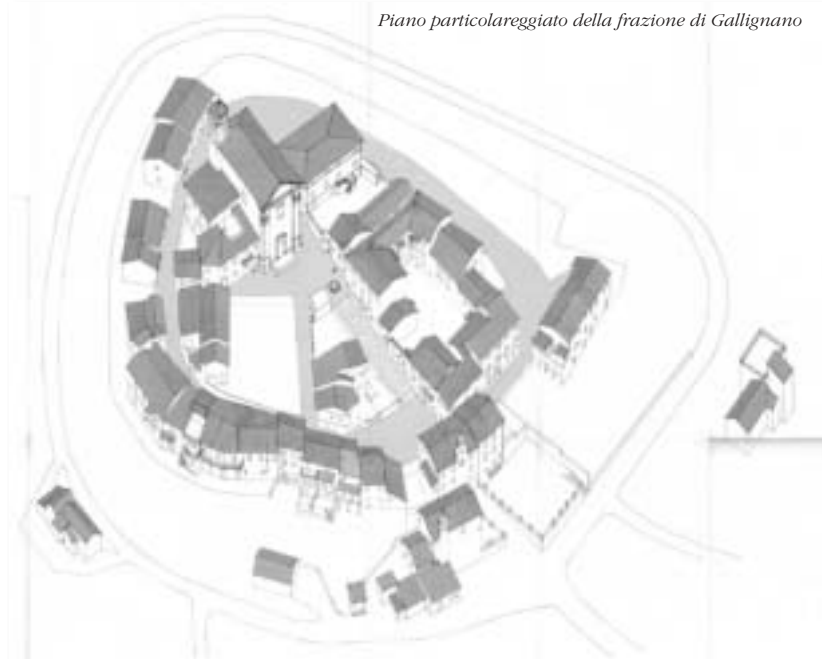
Piano particolareggiato della frazione di Gallignano

Il quaderno monografico del 1998 della rivista "Urbanistica", dedicato appunto alla sua figura, resta un punto di riferimento fondamentale per la valutazione di questi due decenni di storia urbanistica e architettonica di Ancona e delle Marche, nelle quali Paci si inserì attivamente con un ruolo di primo piano.