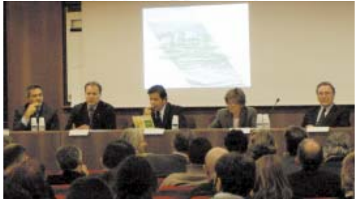
Un momento della manifestazione

Attualmente al nuovo Coordinamento Regionale di A21 della Lombardia hanno aderito formalmente 39 Comuni : Bareggio, Brescia, Buccinasco, Cesano Maderno, Cinisello Balsamo, Corsico, Crema, Cremona, Desio, Iseo, Lecco, Legnano, Lodi, Mantova, Marone, Meda, Pavia, San Donato Milanese, San Giuliano, Sesto San Giovanni, Seveso, Varedo, Villa Di Serio, Vimercate (rappresenta anche gli altri 15 Comuni del "Coordinamento Sviluppo Sostenibile del Vimercatese-Trezese"), su 1.546 (2.5 %), per 1.131.527 abitanti su 9.108.645 (12.5 %); 6 Province (Cremona, Lecco, Mantova, Milano, Pavia, Varese) su 11 (55%), per 6.072.804 abitanti su 9.108.645 (67%); 1 Ente Parco (Parco Adda Nord) e 1 Comunità Montana (Comunità Montana Parco Alto Garda Bresciano).