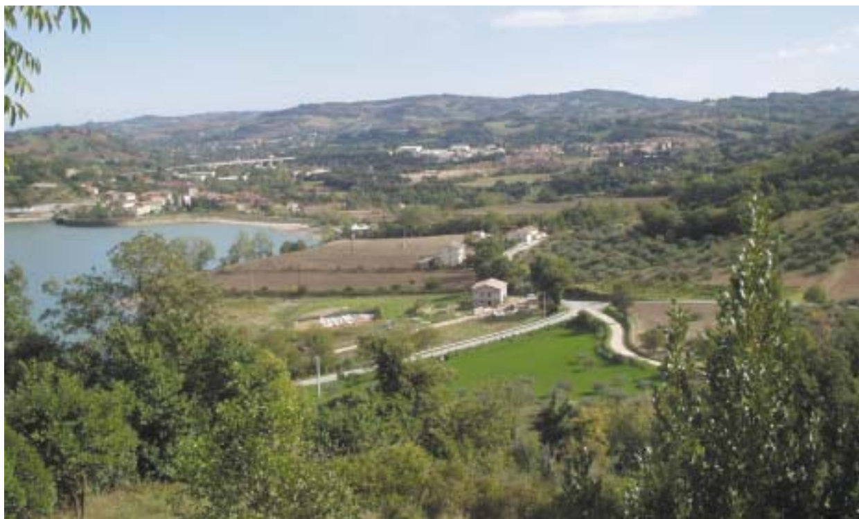
Pievefava di Caldarola e il lago di Caccamo

L'attuazione degli obiettivi e dei programmi ambientali enunciati nel documento si attueranno attraverso un Sistema di Gestione Ambientale (SGA) sviluppato sulla base dei requisiti indicati dal dell'allegato 1 del regolamento che riporta integralmente i contenuti della norma ISO 14001 . Il S.G.A. è in grado di attivare un circolo virtuoso di miglioramento continuo che permette di pianificare le azioni, realizzarle, verificare i risultati raggiunti e quindi decidere se mantenere o modificare le decisioni assunte in sede di pianificazione. Infine la comunicazione e la trasparenza si concretizzano nel sistema EMAS attraverso una dichiarazione ambientale pubblica convalidata da