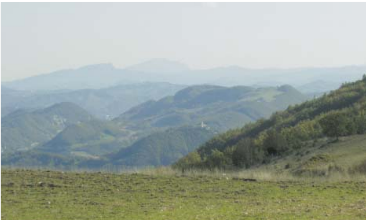
Paesaggio dell'Appennino maceratese

Il progetto, promosso dall'Autorità Ambientale delle Marche e finanziato dal F.E.S.R. 2000-2006 - azione 7.5, interessa il territorio maceratese per i comuni di Esanatoglia e Matelica.