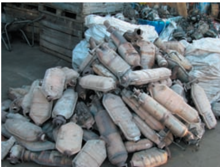
Un lotto di catalizzatori automobilistici esausti.

si concluderanno a breve gli accordi che porteranno, nella vicina primavera, alla fondazione della Techemet Asia , un'azienda partecipata da Invemet con sede a Singapore, che si occuperà della gestione della raccolta dei catalizzatori esausti provenienti da tutto il Sud Est asiatico e dall'India. È un ulteriore passo per il Gruppo Techemet e per Invemet in particolare verso una presenza sempre più globale ma al contempo adattata, di volta in volta, alle esigenze dei singoli Mercati.